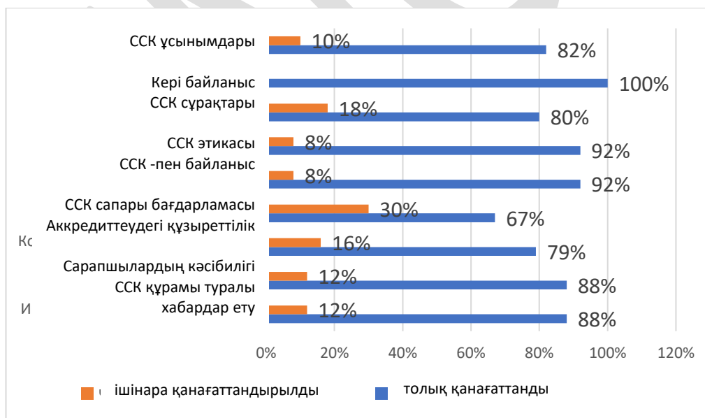
Сурет 1. Әкімшілік өкілдерінің сауалнамасының нәтижелері (n=135)

Әкімшілік қызметкерлер арасынан келген респонденттер өздерінің кәсіби құзыреттілігі мен аккредиттеу тәжірибесін (92%) ескере отырып, сарапшыларды іріктеуге толық қанағаттанды (98%). Кейбір жағдайларда (3%) респонденттер кейбір кандидатуралармен таныс емес (халықаралық немесе республикалық іс-шараларда бұрын естімеген, кездеспеген), бірақ бұл Сарапшы кандидатурасын қабылдамауға себеп болған жоқ. 2 сауалнамада сарапшылардың кандидатуралары қабылданбағаны туралы ақпарат болды, өйткені бұл сарапшылар бұрын аккредиттелетін білім беру ұйымында жұмыс істеген немесе ББҰ басшылығымен ортақ жарияланымдары болған.